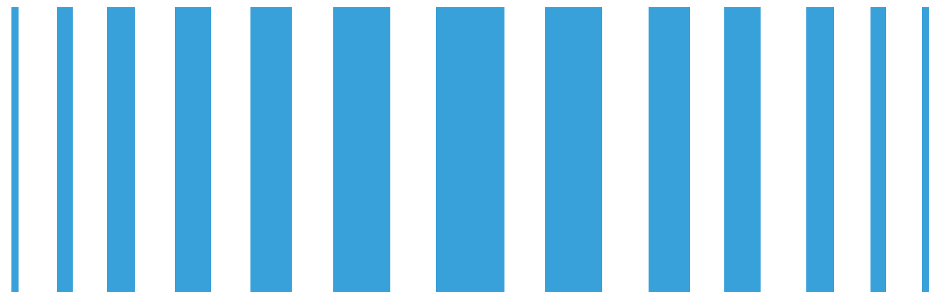
48 Maak een eind aan menstruatie-armoede op de schoolbanken , Vlaamse Scholierenkoepel (mei, 2023)

Volgens scholieren is het overduidelijk dat menstruatie-armoede op school aangepakt moet worden. Maar liefst 9 op de 10 bevraagde scholieren deelt deze mening. Daarnaast is ook 9 op 10 ervan overtuigd dat kosteloze menstruatieproducten beschikbaar moeten zijn op school. Hoewel deze aanpak revolutionair en vernieuwend kan klinken, is het dit eigenlijk niet. Sinds 2022 zijn lokale overheden en onderwijsinstellingen in Schotland verplicht om kosteloze tampons en maandverband aan te bieden aan iedereen die het nodig heeft. Dit jaar is hetzelfde gebeurd in Spanje. Groot-Brittannië en Nieuw-Zeeland hebben wetten die ervoor zorgen dat menstruatieproducten kosteloos beschikbaar zijn op scholen. Vlaanderen en Brussel moeten dit voorbeeld volgen. Achterblijven kan volgens scholieren niet. Ons advies rond het thema voorziet meer context, cijfers, scholierenquotes en beleidsaanbevelingen. 48